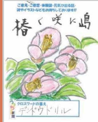
クロスワードの答え デネウドリル