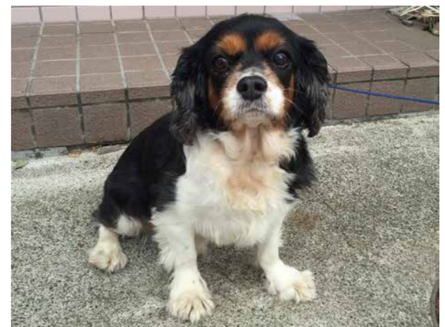
☆ のんたくん 8才 ☆